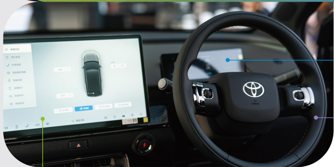
14.6吋輕觸式屏幕音響系統 連導航系統及無線Apple CarPlay